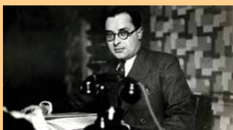
Jean Zay, le jeudi 3 avril à 20h30