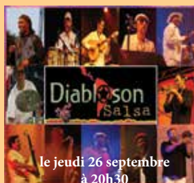
le jeudi 26 septembre à 20h30