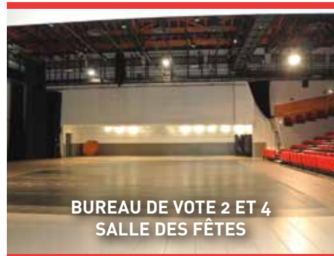
BUREAU DE VOTE 2 ET 4 SALLE DES FÊTES