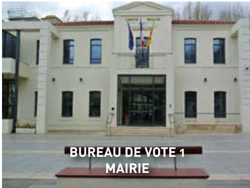
BUREAU DE VOTE 1 MAIRIE