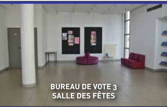
BUREAU DE VOTE 3 SALLE DES FÊTES